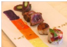
Tano passami l'olio